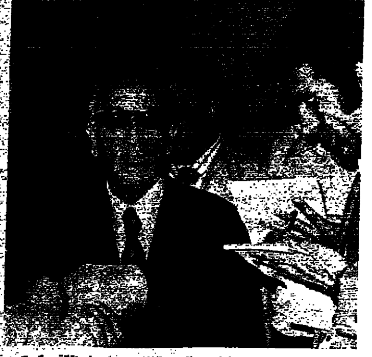
رئيس الحكومة العميد اول نور الدين الرقاعي يعين استقالة حكومته

تحدث الشيخ بيار الجليل رئيس الكتلبة امس ، الى الصحفيين والمراسلين الاجانب في بيروت ، عن اسباب الأزمة الصحية التي يعيشها لبنان ، وموقف الكتلة من الوضع الحكومي ، بعد الاحداث الاخيرة . وجاء في حديثه قوله : ان مشكلتنا لم تكن يوماً مع الشعب الفلسطيني ، او مع العمل الدنالي الذي يرأسه او مع العمل الفدائي الذي يرأسه او مع الفدائيين . واضاف : ان مشكلتنا دائماً هي مع الفرياء ، الذين يستبدون من النظام اللبناني والتواجد الفلسطيني في لبنان ، لاعمال ضد النظام وضد الفلسطينيين ، والمهامة التي نعيشها لبنانية وفلسطينية في آن .